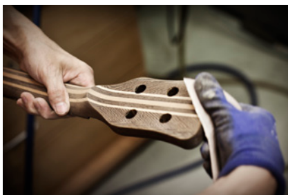
Framus & Warwick Masterbuilt