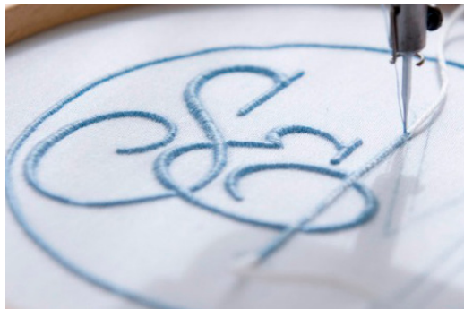
Strunkmann & Meister

Das 1832 gegründete Bielefelder Traditionsunternehmen Strunkmann & Meister beliefert herrschaftliche Residenzen wie das Königshaus in Saudi-Arabien, politische Amtssitze wie die Villa Hammerschmidt und kultivierte Privatanwesen mit feinsten Tisch- und Bettwäsche. Klar Seifen ist die älteste Seifenmanufaktur Deutschlands und produziert seit 1840 edle Seifenprodukte und künstlerische Seifenskulpturen in Heidelberg.