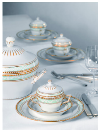
Königliche Porzellan Manufaktur (KPM) Berlin

Historisch gesehen war die Manufaktur (lat.: manus und factura) im 18. Jahrhundert der Prototyp der industriellen Warenproduktion, der Übergang vom klassischen Handwerk zur modernen Fabrik. Gekennzeichnet waren die Betriebe vor allem durch einen arbeitsteiligen Produktionsprozess, die Zusammenarbeit verschiedener Gewerke, und die im Vergleich zum Handwerksbetrieb relativ große Mitarbeiterzahl. Porzellan, Seide, Tapiserie oder Kunstblumen - rückblickend können die Manufakturen als Keimzelle des Wirtschaftsstandorts Deutschland bezeichnet werden.